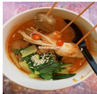
Gambar 2. Sukiyaki