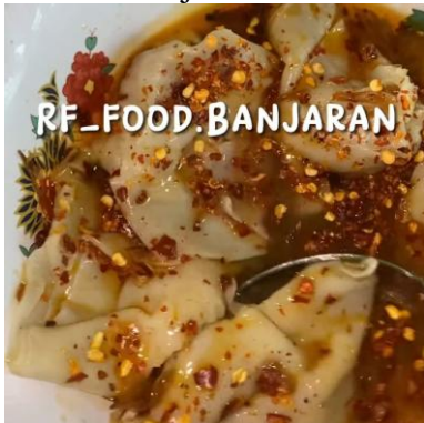
Gambar 1. Pangsit Ayam Chili Oil