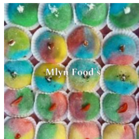
Gambar 2. Mochi