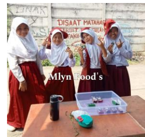
Gambar 4. Buyer Mlyn Food's