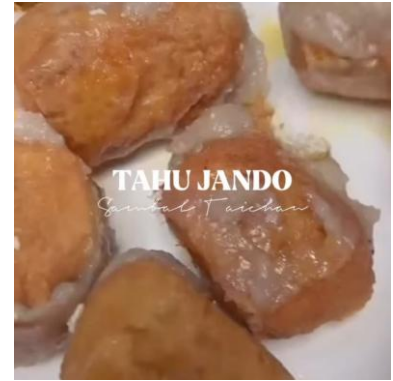
Gambar 3. Tahu Jando Sambal Taichan