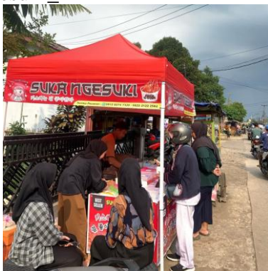
Gambar 1. Outlet Sukangesuki_