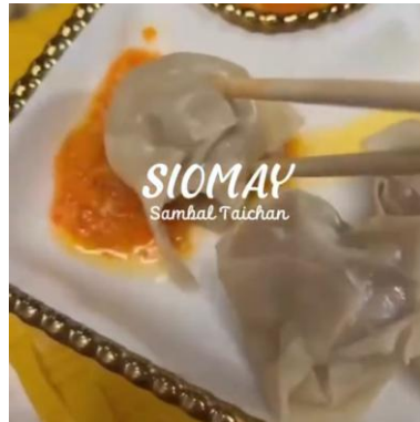
Gambar 2. Siomay Sambal Taichan