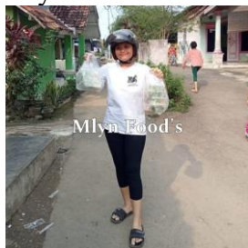
Gambar 1. Mlyn Food's Owner