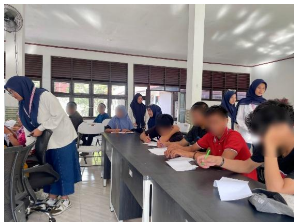
Gambar 5. Sesi Post-Test

Selanjutnya, peserta diminta kembali mengisi kuesioner sebagai post-test. Tujuannya adalah untuk mengevaluasi sejauh mana pemahaman dan perubahan terjadi setelah mengikuti kegiatan