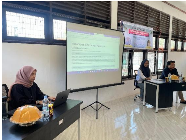
Gambar 1. Sesi Pembukaan

Pada tahap 3 : Sesi Sambutan Perwakilan Sentra Wirajaya Makassar