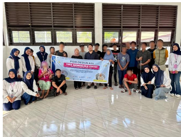
Gambar 7. Dokumentasi Seluruh Peserta, Narasumber, dan Panitia