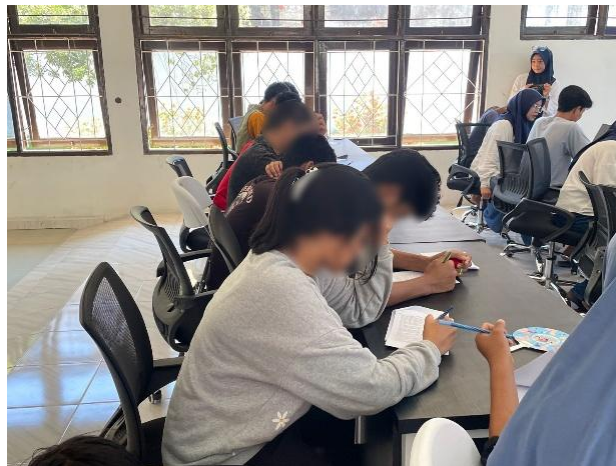
Gambar 2. Sesi Pre-test

Peserta diberikan lembar pre-test yang bertujuan untuk mengukur tingkat pemahaman dan kondisi awal terkait topik agresivitas dan emosi sebelum menerima materi. Peserta diarahkan untuk mengisi kuesioner secara jujur berdasarkan kondisi yang peserta rasakan.