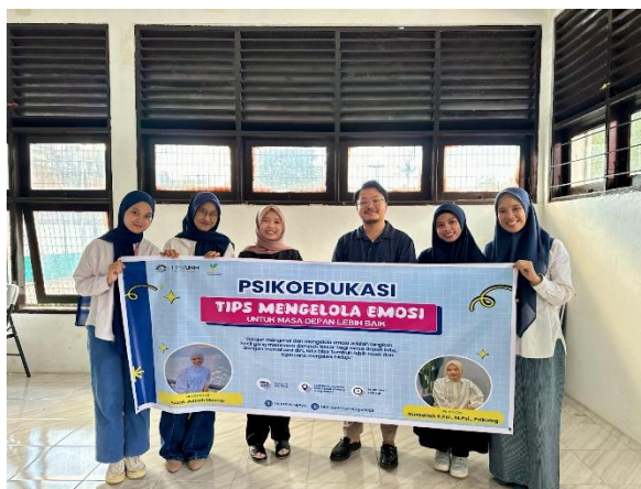
Gambar 8. Dokumentasi Tim BKP Sentra Wirajaya Makassar bersama Narasumber