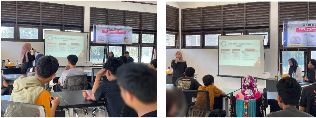
Gambar 3. Pemberian Materi