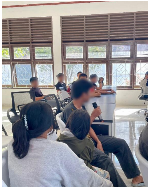
Gambar 4. Sesi Tanya Jawab

Setelah pemberian materi, peserta diajak untuk melakukan refleksi diri dan berbagi pengalaman melalui sesi sharing dan diskusi. Kegiatan ini bertujuan untuk memperkuat pemahaman peserta dan mendorong penerapan keterampilan yang telah dipelajari.