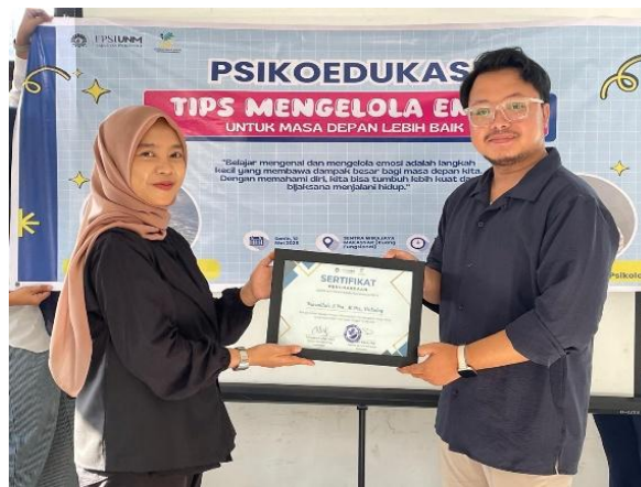
Gambar 6. Sesi Pemberian Sertifikat

Kegiatan ditutup dengan penyampaian kesimpulan oleh perwakilan sentra wirajaya, pemberian motivasi kepada peserta, serta ucapan terima kasih atas partisipasi pada kegiatan psikoedukasi.