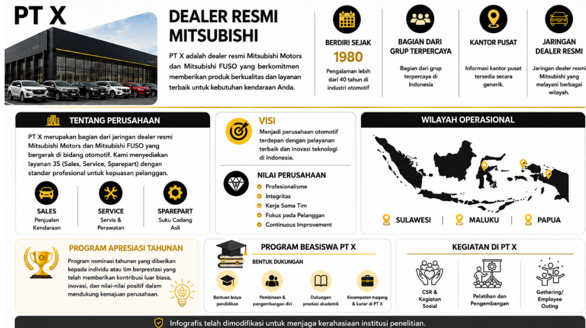
Gambar 1. Contoh Infografis yang digunakan untuk melakukan psikoedukasi

generasi muda yang sedang menempuh pendidikan akhir atau baru lulus, yang memiliki potensi menjadi tenaga kerja perusahaan di masa depan. Infografis dipilih sebagai media karena mampu menyajikan informasi secara visual, ringkas, dan mudah dipahami, sesuai dengan karakteristik Gen Z yang terbiasa mengonsumsi konten digital.